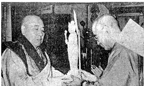
圖 5 隨玄奘靈骨來臺之觀音聖像 72

按照報導所述，全日本佛教會除了送回玄奘靈骨外，還將贈送一尊原存於奈良法隆寺的「國寶」解夢觀音給臺中寶覺寺，是一金銅觀音像。此報導乃是幼獅社在東京撰寫後發文回臺刊登，顯然此一消息乃是在日本所悉。值得注意的是，中央日報的報導還附上解夢觀音的相片，但相片卻是 1954 年底就已送至寶覺寺的「金銅」觀音像，而非後來送至臺灣的木刻觀音像。顯然此一報導之內容雖發於東京，但相片卻是臺灣本地記者在刊登新聞時所附上，而且相片來源應是來自臺中寶覺寺。