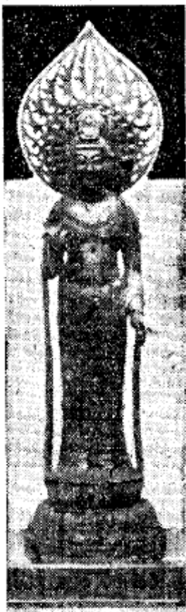
圖 6 中央日報揭載之解夢觀音 73

據寶覺寺發行的《覺生》月刊第 53、54 期合刊（1954.12）刊載，原訂於 1954 年 10 月訪臺的日本佛教訪問團，計畫贈送一尊「解夢觀音」與大藏經一部給寶覺寺臺中佛學院供養。此一日本