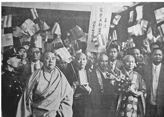
圖 1 1955 年 11 月 25 日玄奘靈骨抵臺 62

玄奘靈骨係裝在一個高約八寸寬約三寸見方的小檀木盒內，外面寫有「三藏法師玄奘頂骨盒」九字，25 日先奉置於善導寺。26 日上午 9 時在善導寺由中日雙方代表舉行交接待典禮。 61 隨著玄奘靈骨來臺的，另有全日本佛教會贈送給中國佛教會的觀音像一尊。