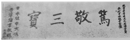
圖 8 芳澤謙吉贈匾 79