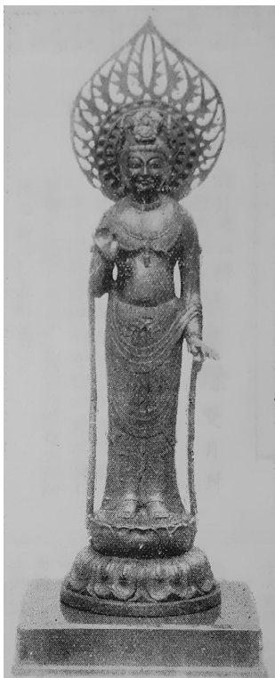
圖 7 《覺生》月刊掲載之解夢觀音像 78